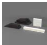
Art. Nr. 101430/101431/101434/101438/101444

Art. Nr. 101430, 101431, 101434, 101438, 101444