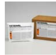
Art. Nr. 104010