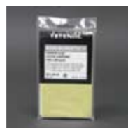
Art. Nr. 101313

Hergestellt aus einem Material, das aus hunderten von fibrillierten Fäden gesponnen wird, bietet dieses High Tech Tuch die optimalen Eigenschaften zur denkbar schonendsten Reinigung und Pflege optischer Gläser. Vorteil: Fusselfrei, da keine groben Abschnittkanten. Abmessung: 20 x 25 cm, Farbe: Weiß. Art. Nr. 101315