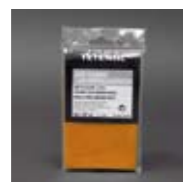
Art. Nr. 101312