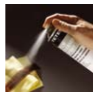
Filmcleaner Spray Dose mit 400 ml Art. Nr. 105198

Schutzgas. Vermeidet vorzeitige Oxidation von fotografischen Bädern. Verlängert die Haltbarkeit von Konzentraten und Gebrauchslösungen. Einfache Anwendung: Protectan in teilgefüllte Flaschen/ Kanister sprühen – das neutrale, schwere Gas verdrängt die Luft und sorgt so für lang anhaltenden Schutz. FCKW-frei. Dose mit 400 ml. Art. Nr. 105193