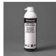
Art. Nr. 103043

etc. Die 200 ml Spraydose ist mit einem fest montierten Sprühkopf ausgestattet und liefert ca. 50 Liter Druckgas. Ein mitgeliefertes flexibles Sprührohr ermöglicht die Behandlung selbst verwinklter Objektive. FCKW frei. Dose mit 200 ml. Art. Nr. 103030