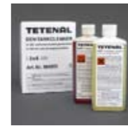
Art. Nr. 104005

mit hydrochinonfreien Entwicklern, wie z.B. Eukoprint Prof. AC. Art. Nr. 104010