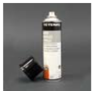
Art. Nr. 105195

Tiefmatt, feinst pigmentierter Speziallack. Perfekt für Ausbesserungen an Kameras, Objektiven, optischen Geräten, etc. FCKW-frei. Dose mit 200 ml. Art. Nr. 105202