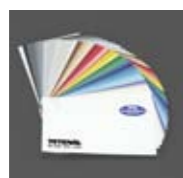
Art. Nr. 350557