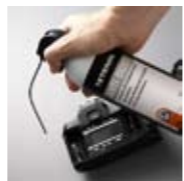
Art. Nr. 103030