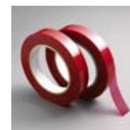
Red Splicing Tape 19 mm x 66 m Art. Nr. 103241

Hochwertiges rotes Silikonklebeband für Leaderkarten, das sich durch eine hervorragende Haftung an Filmstreifen und Leaderkarte auszeichnet und rückstandsfrei wieder ablösen lässt. Das Band hält allen Chemikalien bestens Stand, ist äußerst reißfest und gewährleistet dank seiner speziellen Rückseitenbeschichtung ein leichtes Abrollen. 19 mm x 66 m. Art. Nr. 103241