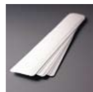
Cleaning Strips für Filmprozessoren Packung mit 20 Streifen Art. Nr. 103072