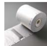
Sleeving Material für Filme als 4er, 5er oder 6er Streifen erhältlich Art. Nr. 103283/103284/103285