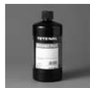
Art. Nr. 104571/104575