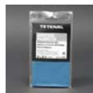
Art. Nr. 101308

Antistatisch imprägniertes Tuch aus ultraweichem, an den Rändern eingesäumtem, fussellosem Spezialgewebe, das Staub mit einem Wisch beseitigt und einer elektrostatischen Aufladung der Oberfläche effektiv vorbeugt. Spitzenqualität. Abmessungen: 28 x 37 cm, Farbe: Orange. Art. Nr. 101312