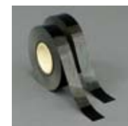
Extractor Tape 16 mm x 10 m Art. Nr. 103246