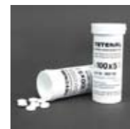
Art. Nr. 103152