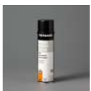
Art. Nr. 102216