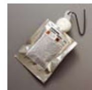
Art. Nr. 106080

Anti Algenmittel für Wässerungen in Schwarz / Weiss, Röntgen und PrePress Prozessen. Verhindert die Bildung von schleimigen Ablagerungen - hält Wassertanks sauber. Algenex Plus wird täglich nach Arbeitsende zugegeben, Dosierung 1,5 - 3 ml pro Liter Wasser. Nicht geeignet für. Colorprozesse. 10 Tabletten à 20 g. Art. Nr. 106080