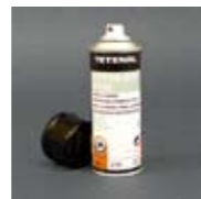
Art. Nr. 105202