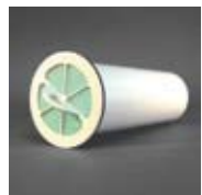
Art. Nr. 103057