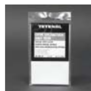
Art. Nr. 101315