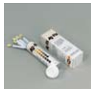
Art. Nr. 101243