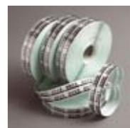
Twin Check Labels 4 Rollen à 2500 Nummern Art. Nr. 103299

2-fach Labornummern liefern das einzig sinnvolle System für eine klare und eindeutige Zuordnung von Filmen und Abzügen. Selbstklebende Tetenal Twin Check Labels aus Polyester haften besonders sicher an den Filmstreifen und sind gegenüber allen Fotochemikalien resistent. Die Labels werden in Packeinheiten zu 4 Rollen à 2500 Nummern (7 x 20 mm) geliefert. Art. Nr. 103299