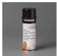
Art. Nr. 101638