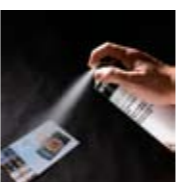
Art. Nr. 105190

Lichtschutzlack-Spray glänzend/matt Licht, Wärme und Feuchtigkeit greifen im Laufe der Zeit die Bildfarbstoffe in Colorbildern an und zersetzen diese. Die Folge: Ein allmähliches Ausbleichen oder Fleckigwerden der Bilder. Einen wirksamen Schutz bietet TETENAL Lichtschutzlack: Dank seines besonders hohen Anteils an UV-Absorbern wandelt er die farbstoffstörenden UV-Strahlen des Lichtes in energieschwaches Licht um. Einfach Aufsprühen, und der transparente Lackfilm versiegelt die Bildeoberfläche zuverlässig. Labortipp: Für Ink Jet-Papiere wie z.B. TETENAL spectra jet nur Ausführung glänzend verwenden. FCKW-frei. Dose mit 400 ml. Art. Nr. 105190/105192