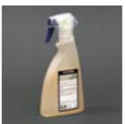
Art. Nr. 103402

Praktischer Reiniger in der Sprühflasche, speziell für die schnelle Reinigung von Farbentwickler Racks. Beseitigt im Nu teerige Ablagerungen und Entwickleroxidaionsprodukte. Ideal für Kunststoff, Glas, Stahl und Gummi. Einfache Anwendung: aufsprühen, kurz einwirken lassen und mit Wasser abspülen. 0,5 l Flasche mit integriertem Sprühkopf. Art. Nr. 103402