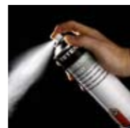
Art. Nr. 105194

Dieser exklusiv für den Imaging-Bereich entwickelte Spezialkleber eignet sich ideal für das schnelle und flexible Kaschieren von Photos, Poster und Zeichnungen auf Karton, Spanplatte, Metall und vielen weiteren Materialien. Die elastische, wasserfeste Haftschrift schafft eine dauerhafte Bindung, sobald die Bilder fest angedrückt werden. Zuvor lässt sich deren Position problemlos korrigieren; auch Falten und Luftblasen können „ausgestrichen“ werden. FCKW-frei. Dose mit 400 ml. Art. Nr. 102216